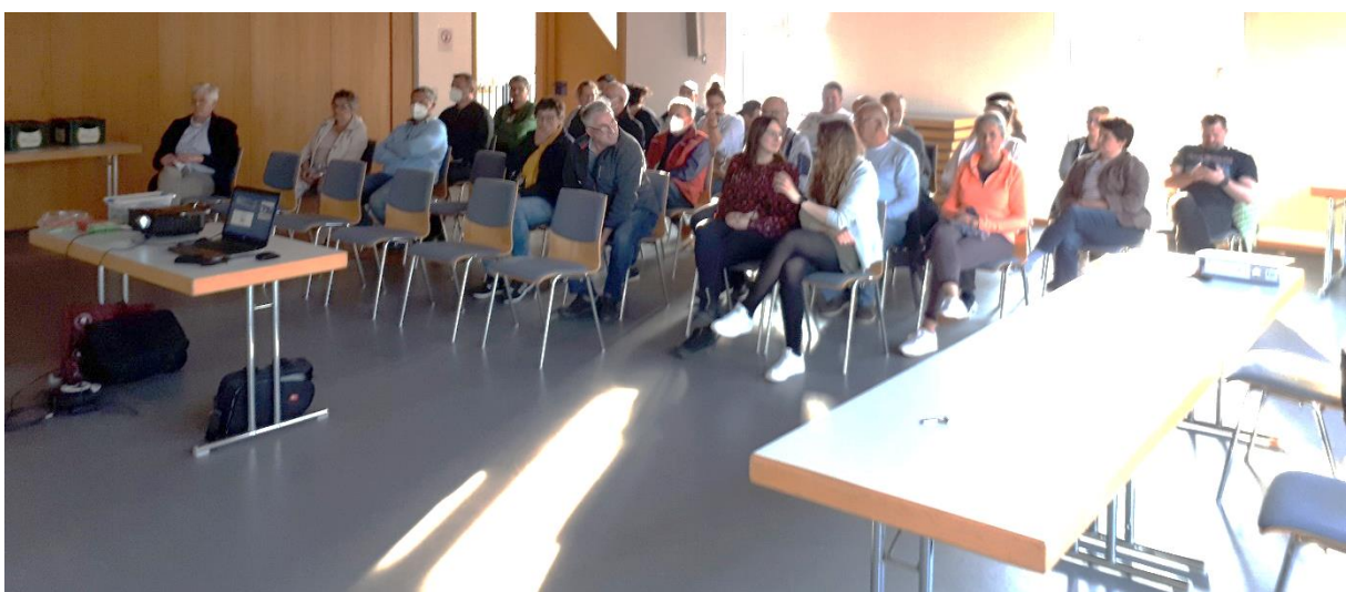
Impressionen aus der Auftaktveranstaltung